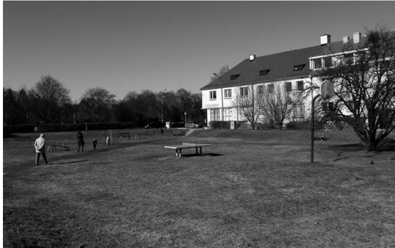
Рис. 3. Ігровий майданчик у сквері поблизу вул. Е. Дембовського

Третій об'єкт дослідження розміщений далеко від центру міста в околицях ріки Одер. Невеликий за площею, недавно влаштований майданчик, містить ігрові елементи, лави і корзини для сміття. По периметру оточений загорожею, що охороняє територію від тварин та запобігає вибіганню дітей за її межі. Ігровий майданчик розміщений на піщаній поверхні, територія не насичена декоративними насадженнями. Поза огорожею зростає декілька екземплярів берези повислої ( Betula pendula Roth.). Однак, у сонячні дні ігровий майданчик не притінений. Фонові насадження, які зростають по периметру скверу не включені у формування простору досліджуваної території.