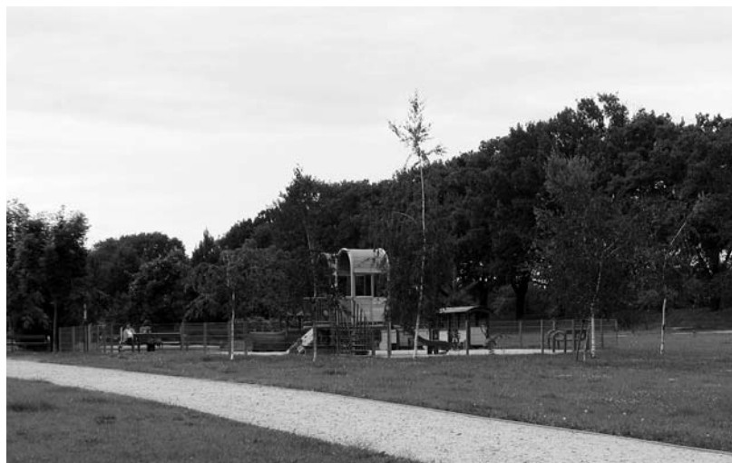
Рис. 4. Ігровий майданчик неподалік від ріки Одер

Третій об'єкт дослідження розміщений далеко від центру міста в околицях ріки Одер. Невеликий за площею, недавно влаштований майданчик, містить ігрові елементи, лави і корзини для сміття. По периметру оточений загорожею, що охороняє територію від тварин та запобігає вибіганню дітей за її межі. Ігровий майданчик розміщений на піщаній поверхні, територія не насичена декоративними насадженнями. Поза огорожею зростає декілька екземплярів берези повислої ( Betula pendula Roth.). Однак, у сонячні дні ігровий майданчик не притінений. Фонові насадження, які зростають по периметру скверу не включені у формування простору досліджуваної території.