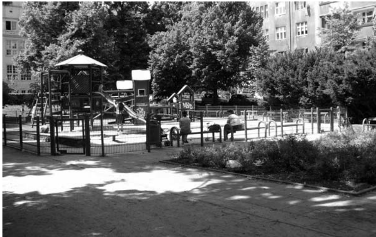
Рис. 2. Ігровий майданчик у сквері поблизу вул. І. Лукашевича

Перший сквер узятий для аналізу, розміщений між вулицями Марії Складовської-Кюрі, Ігнатія Лукашевича та Мар'яна Смолуховського. Ділянка зосереджена у центрі міста (поблизу поля Регана), серед багатоповерхових житлових будівель. Територія скверу виконує рекреаційну функцію для студентів, дітей і старших осіб. Південно-західна частина скверу призначена для наймолодших дітей, з огляду на присутність ігрового майданчика. Простір не має виразного облаштування, хоча можна виділити стежкову мережу і елементи благоустрою у вигляді декількох видів лав, корзин для сміття і двох шахових столиків. Сквер виконує і транзитну пішохідну функцію з огляду на межування з територіями клінічної лікарні та вищих навчальних закладів (Вроцлавським політехнічним Університетом, Медичним Університетом). Сквер наповнений диференційованою рослинністю, серед видів вирізняємо наступні: липа серцелиста ( Tilia cordata Mill.), граб звичайний ( Carpinus betulus L.), гірकोкаштан звичайний ( Aesculus hippocastanum L.). Поряд з ігровим майданчиком зростає тис ягідний ( Taxus baccata L.), який, як відомо, є дуже отруйною рослиною. Насадження ділять простір на зони, формують огороження від вулиці (живопліт із граба звичайного ( Carpinus betulus L.), рядова посадка із липи серцелистої ( Tilia cordata Mill.)) та надають притінку у сонячні дні.