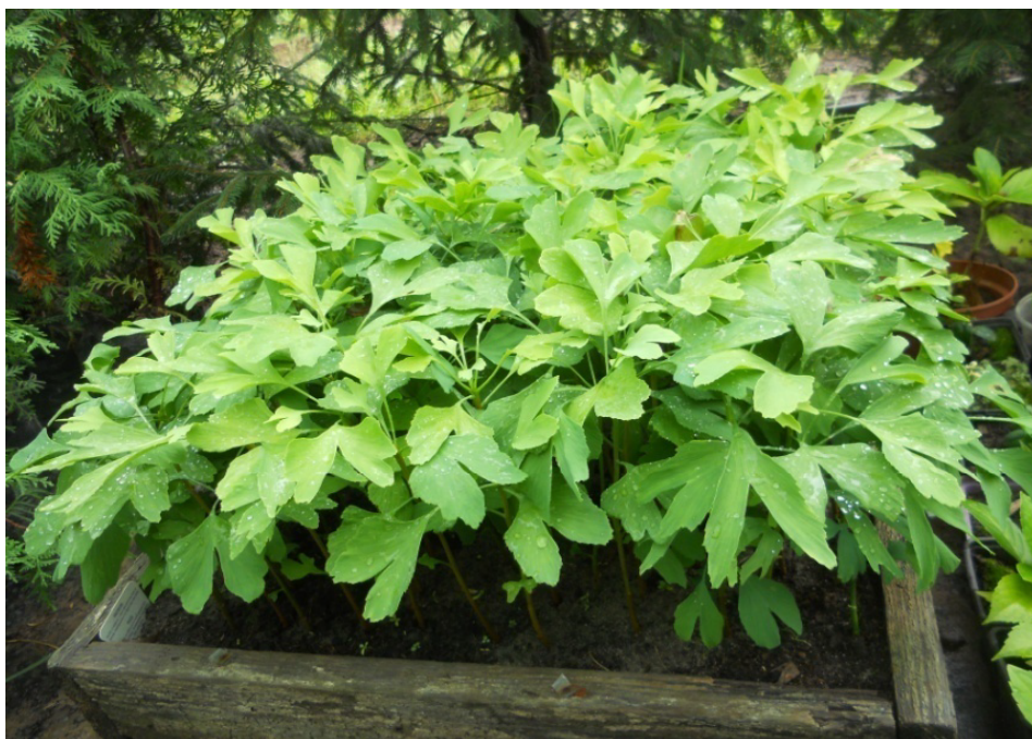
Рис. 1. Сіянци Ginkgo biloba L. вирощені в закритому ґрунті (15.08)