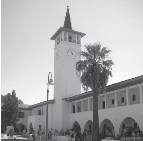
Рис. 1. Навчальний корпус Кіпрського університету

та 6 адміністративних і господарських споруд. Планувальна структура навчальних корпусів галерейного типу, що являє собою групування відкритих терас навколо внутрішніх дворів (рис. 1). Ця об'ємно-планувальна схема будівель відповідає природним умовам Кіпру, адже вона забезпечує орієнтацію приміщень, яка виключає перегрів і необхідність наскрізного провітрювання. Стіни будівель пофарбовані в білий колір, а віконні рами та двері – синьо-блакитні, що є характерним для середземноморського стилю.