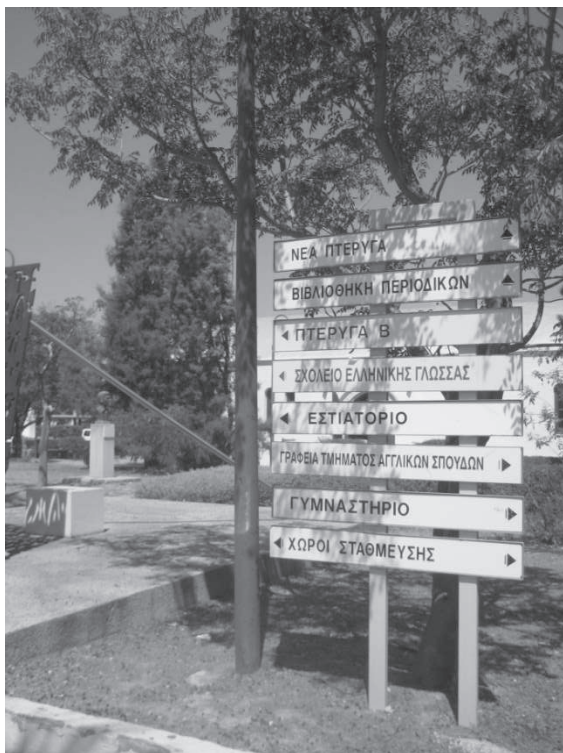
Рис. 5. Стенд на території університету

споруди декоративного призначення – фонтани. Лави, урни та світильники виконані в єдиному стилі та з одних матеріалів, завдяки чому вони є