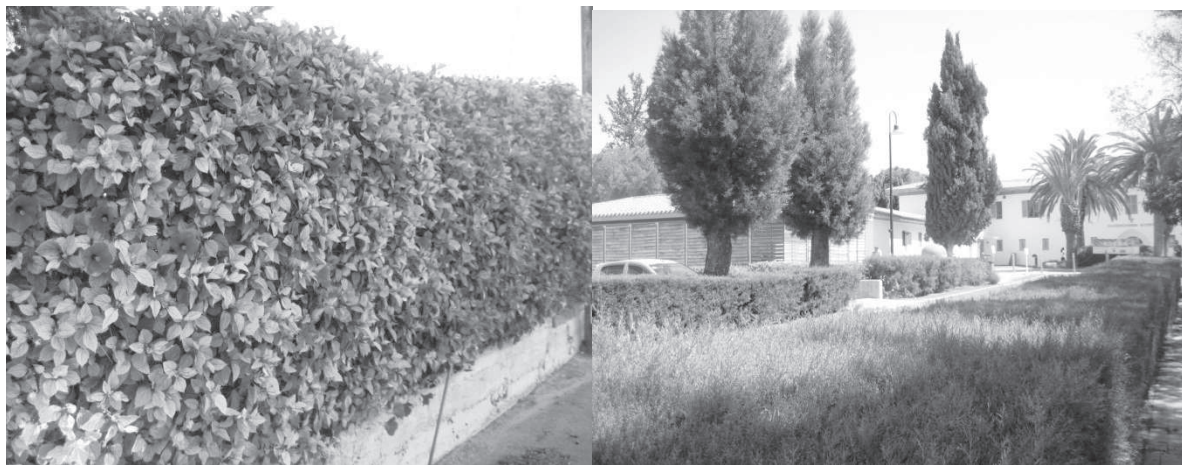
Рис. 8. Живоплоти на території кампусу

Для внутрішніх двориків навчальних корпусів характерним є високий ступінь озеленення, який сформований переважно із живоплотів та солітерних посадок. Крім того, досить часто живоплоти зустрічаються вздовж доріжок та алей. Найчастіше вони створені з екзотичних для нашої країни – Hibiscus syriacus L., Ficus benjamina L. та Rosmarinus officinalis L., проте нерідко використовують й широко розповсюджені – Thuja occidentalis L. та Chamaecyparis lawsoniana (A.Murray bis) Parl. (рис. 8).