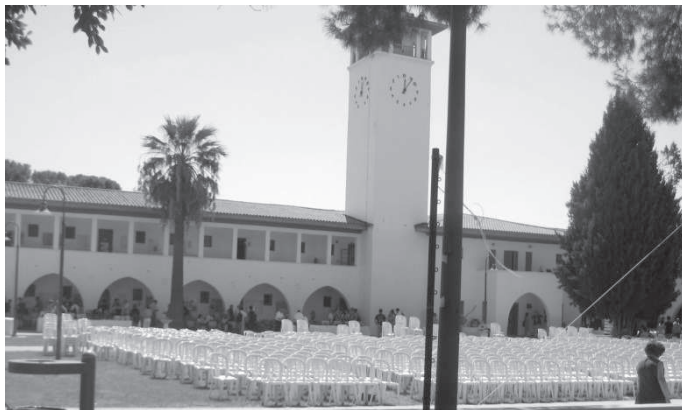
Рис. 6. Галявина для проведення урочистих заходів

Як зазначалося вище, озеленені ділянки займають більшу частину від загальної площі території університетського містечка. Для зелених зон характерним є наявність великих площ газонного покриття, на якому досить часто встановлюють меблі для проведення різноманітних відкритих занять, зборів та урочистих заходів університету (рис. 6). Незважаючи на це, газон перебуває в хорошому стані (відсутня бур'яниста рослинність, а проектне покриття складає близько 95 %), тому можна стверджувати, що він є стійким до витоптування завдяки травам, які входять до його складу і мають високу енергію відновлення після навантажень. На порівняння, газонний покрив на територіях навчальних корпусів національних університетів м. Києва, в переважній більшості, перебуває в задовільному стані. Проте все ж на деяких територіях зустрічаються ділянки з відмінним газонним покривом.