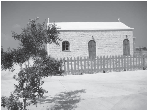
Рис. 3. Кам'яна церква

1 – факультет історії та археології; 2 – їдальня; 3 – школа сучасної грецької мови; 4 – лекційні зали; 5 – актові зали; 6 – бібліотека; 7 – інженерні лабораторії; 8 – відділ інформаційних послуг; 9 – факультет досліджень англійською мовою; 10 – гімнастична кімната; 11 – корпус Е (бібліотека/лекційні зали); 12 – каплиця; 13 – корпус В (лабораторії); 14 – господарська будівля; 15 – відділ комп'ютерного забезпечення; 16 – лабораторії; 17 – факультет психології; 18 – факультет досліджень турецькою та близькосхідними мовами