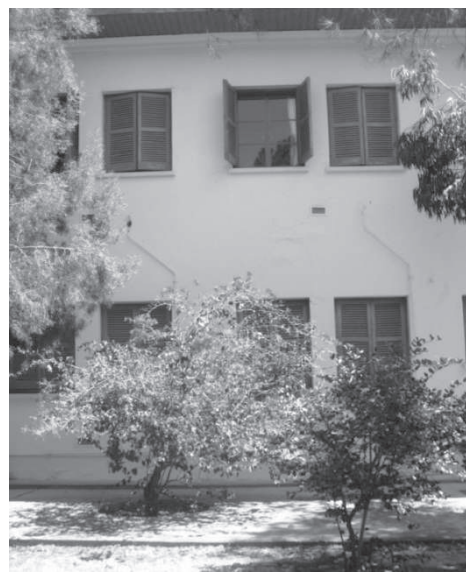
Рис. 7. Nerium oleander L. на території кампусу