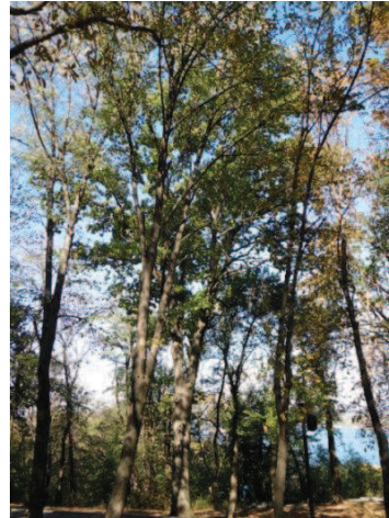
Рис. 3. Дуби звичайні на території заповідника

На сьогодні зазначені рослини мають незвичайний габітус крони, скелетні гілки відходять від стовбура на висоті 10–55 см від кореневої шийки. На зрізах спостерігається грибкова інфекція та ушкодження шкідниками. Якісний стан рослин встановлено як задовільний, вони потребують лікувальних заходів (рис. 4).