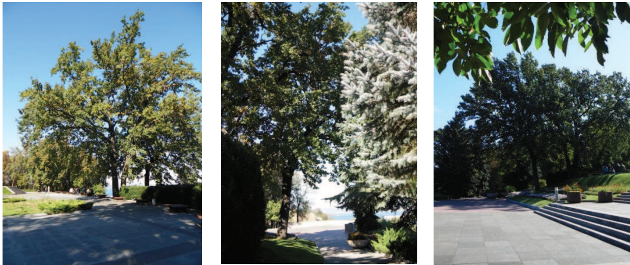
Рис. 2. «Три дуби», що зростають у Шевченківському національному заповіднику

Напередодні святкування 200-річчя від дня народження Великого Кобзаря працівники заповідника розпочали процес із надання цим деревам природоохоронного статусу та занесення їх до реєстру пам'яток природи. Рішенням Черкаської обласної ради від 22 березня 2013 р. № 21-16/IV ці рослини було визнано ботанічними пам'ятками природи [1].