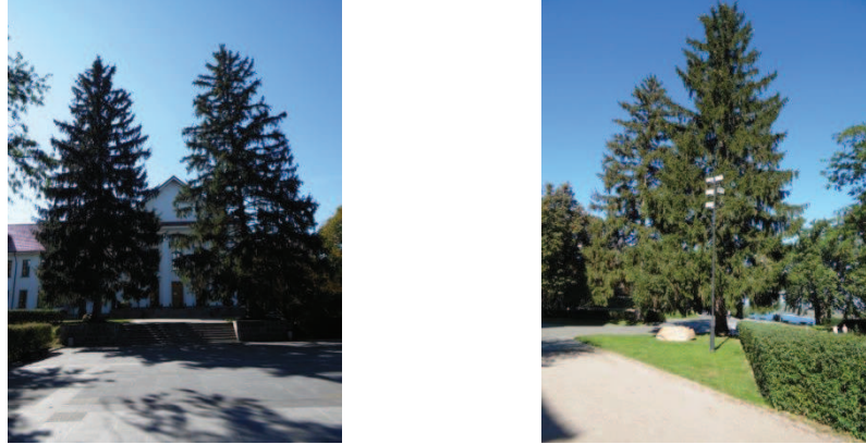
Рис. 7. Ялина колюча біля головного входу до музею Т. Шевченка

Пам'ятні посадки заповідника формують і представники родини соснові ( Pinaceae ) – роду ялина ( Picea Dietr.) (2 екземпляри), які мають діаметр стовбура 68 і 67 см та висоту в межах 22 і 24 м (рис. 7).