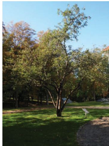
Рис. 4. Яблуні домашні, що зростають у плодовому саду заповідника

На час обстеження стовбур вишні уражений грибковими хворобами. Дерево зростає під значним ухилом. Скелетних гілок у рослини немає, спостерігається лише осьовий стовбур, від якого галузяться гілки (рис. 5). Рослина потребує проведення лікувальних заходів. Інше дерево вишні звичайної має висоту близько 5,5 метрів та діаметр стовбура 48 см.