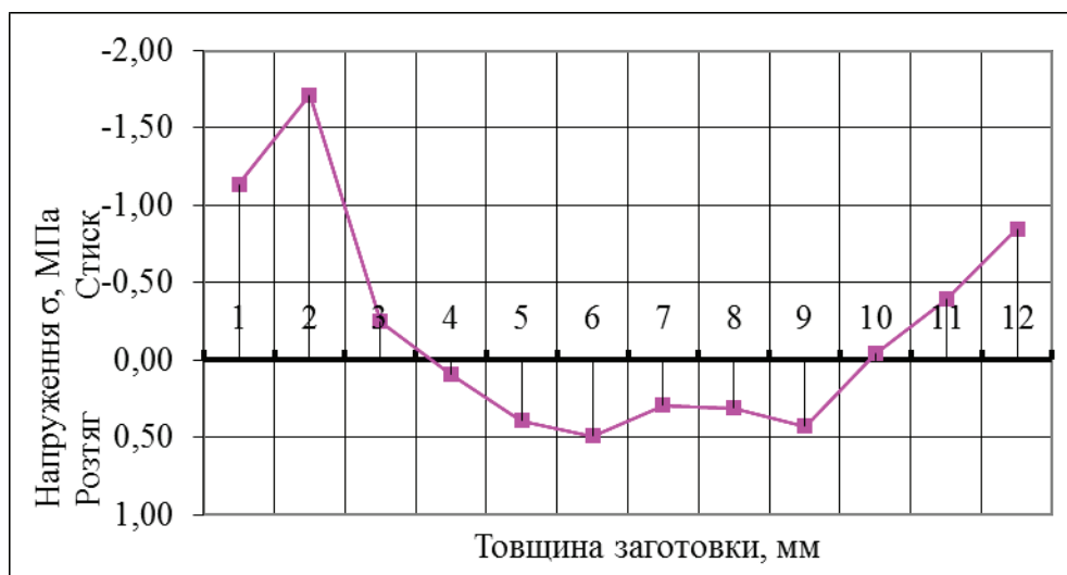
Рис. 3. Епюра залишкових напружень у зразку № 2а

прилягає до неї (рис. 3). Подібні епюри спостерігаються, як правило, в пиломатеріалах під час кінцевої вологотеплообробки, або після її недостатнього проведення [18].