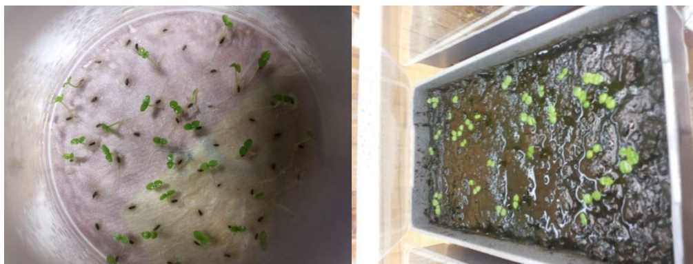
Рис. 6. Сходи павловнії повстистої на 14-й день

За результатами досліджень, при доборі субстрату для пророщування насіння можна стверджувати, що найкращими є торфосуміш для пророщування насіння та торфосуміш із домішкою вермикуліту. Додавання сфагнового моху показало гірші результати на 2–8 %.