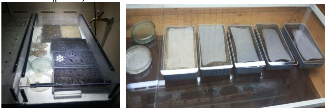
Рис. 3. Загальний вигляд експерименту в лабораторних умовах (ліворуч) та в термостатній (праворуч)

Також насіння пророщували в термостатній, де вологість підтримували штучно шляхом зрошування поверхні субстрату із оприскувача щоденно за таких самих показників температури й освітленості (рис. 3).