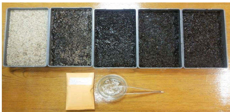
Рис. 1. Загальний вигляд апробованих в експерименті субстратів