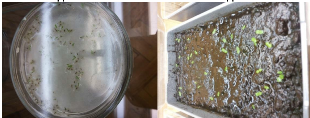
Рис. 5. Сходи павлонії повстистої на 10-й день