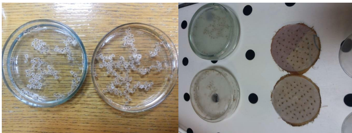
Рис. 2. Загальний вигляд висіяного насіння на дистильовану воду (ліворуч) та на апараті для пророщування насіння (праворуч)

Освітленість перевіряли за допомогою сучасних смартфонів із датчиками освітленості за допомогою програм на зразок LuxMeter та ін.