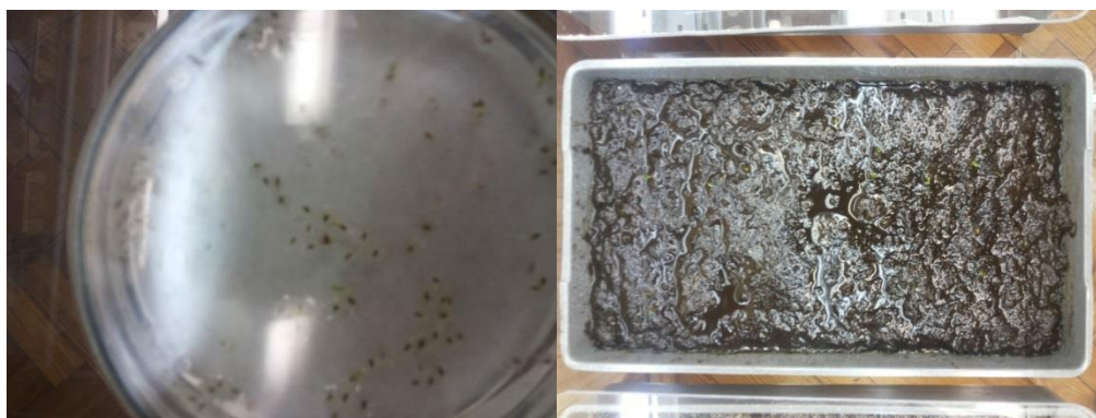
Рис. 4. Сходи павлонії повстистої на 5-й день

Інтенсивність проростання насіння наведено на рисунках 4–6.