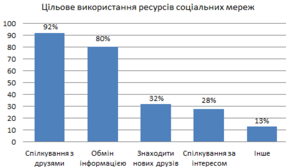
Рис. 4. Гістограма цільового використання ресурсів соціальних мереж

Оскільки у відповідному запитанні анкети пропонувався множинний вибір варіанта відповіді, то результати зручно подати не у відсотках, а як візуальне відображення кількості респондентів, що обрали певний варіант відповіді. Хоча соціальні мережі здебільшого використовуються для спілкування (92 із 100 опитаних) й дозвілля, але значною мірою ці мережі дають можливість для обміну інформацією навчального характеру. Як видно з гістограми, для обміну інформацією соціальні мережі використовують 80 із 100 опитаних, а 28 опитаних спілкуються там за інтересами. Цей потенціал, на нашу думку, може бути продуктивно використаним під час організації навчального процесу.