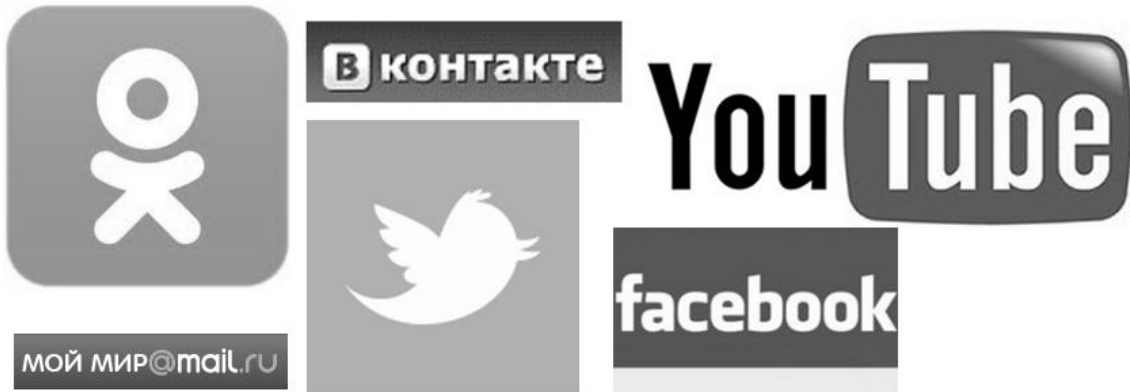
Рис. 1. Найпопулярніші соціальні мережі серед студентів Миколаївського НАУ.

нову інформацію, більш того, бути суб'єктом вільного волевиявлення і дії.