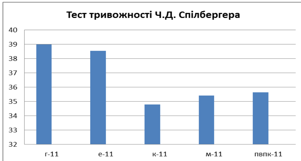
Рис.4. Рівень тривожності у студентів агротехколеджу першого курсу за результатами методики Ч.Д. Спілбергера

За результатами методики Ч. Спілбергера, у 47% досліджуваних виявлено помірний рівень тривожності (середнє значення – 36,7 балів). У таких людей можуть проявлятися якості, як тривожної, так і не тривожної людини. З одного боку ми будемо спостерігати адаптивність до змін навколишніх подій, але не на тому рівні, який притаманний не тривожним людям. Будемо спостерігати занижену самооцінку, хоча не низьку (Рис.4).