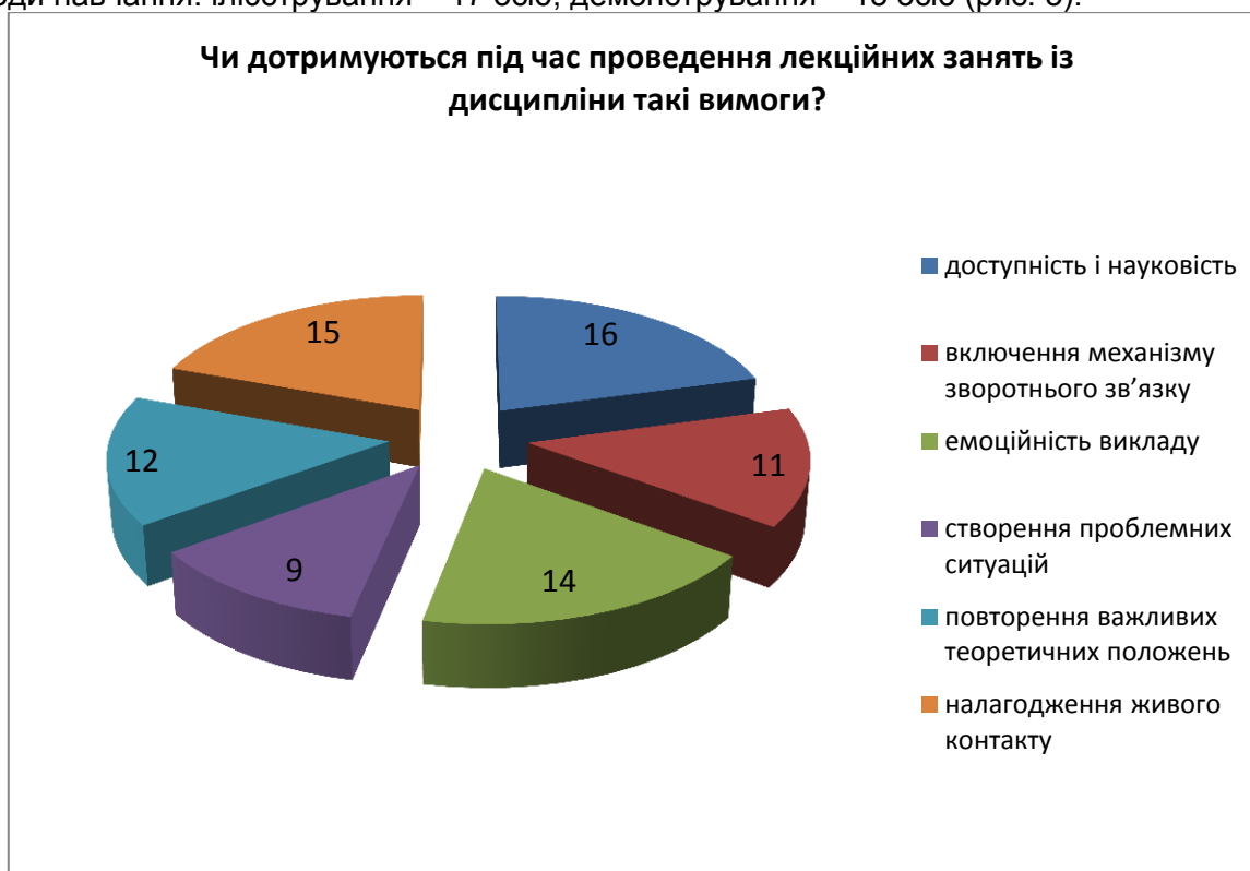
Рис. 3. Дотримання під час проведення лекційних занять із дисципліни основних вимог

Респонденти зазначають, що викладачі найчастіше використовують під час лекцій із дисципліни «Основи педагогічної майстерності та етика викладача вищої школи» такі наочні методи навчання: ілюстрування – 17 осіб, демонстрування – 15 осіб (рис. 3).