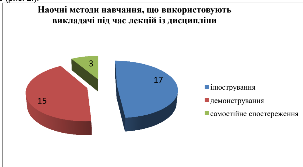
Рис. 3. Наочні методи навчання, що використовують викладачі під час лекцій із дисципліни «Основи педагогічної майстерності та етика викладача вищої школи»

Студенти відмічають, що під час лекційних занять із дисципліни «Основи педагогічної майстерності та етика викладача вищої школи» викладачі найчастіше використовують такі словесні методи: пояснення – 15 осіб, розповідь – 16 осіб, бесіду – 15 осіб, навчальну дискусію – 14 осіб (рис. 2.).