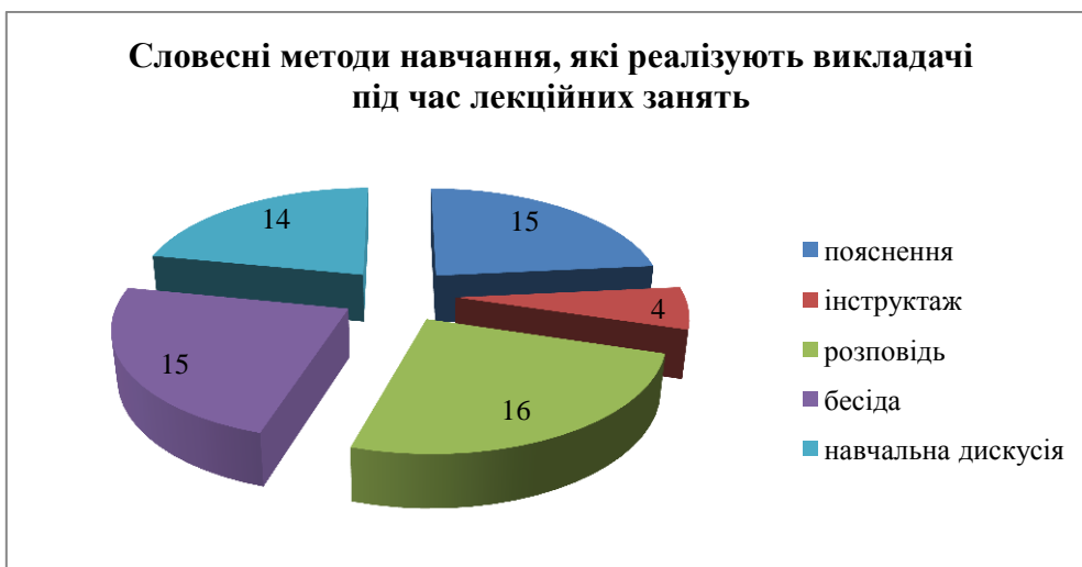
Рис. 2. Словесні методи навчання, які реалізують викладачі під час лекційних занять

Майбутні педагоги хотіли б, щоб викладачі реалізували під час вивчення дисципліни «Основи педагогічної майстерності та етика викладача вищої школи» лекцію із заздалегідь запланованими помилками, але рідко (13 осіб), 7 осіб взагалі не бажають, щоб викладачі проводили лекції зазначеного виду. Це можна пояснити не обізнаністю багатьох студентів (із низьким рівнем знань) щодо впливу різних видів лекцій на пізнавальну активність особистості.