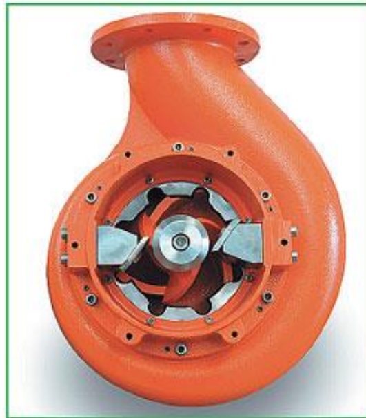
Рис. 6. Насос з подрібнюючим механізмом.

такому разі знову ж таки вимагаються значні витрати на часте очищення, ремонт або закупівлю нових насосів. Крім того, усі роботи по очищенню труб і резервуарів, ремонту насосів повинні проводитися в максимально стислі терміни (застій гною в корпусах недопустимий), а це вимагає відвернення значних трудових ресурсів і техніки від основної діяльності.