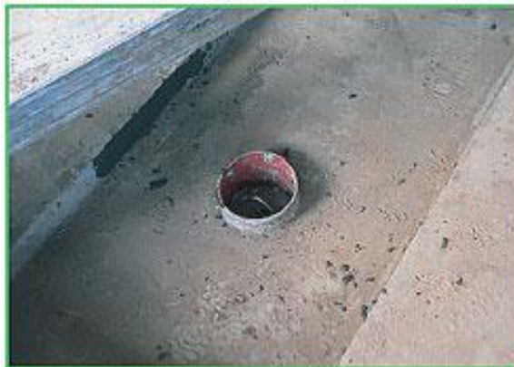
Рис. 2. Правильний приямок з ухилом і з сходиною.

Дуже важливо не лише дотримуватися правильної геометрії ванн при будівництві, але і правильно їх експлуатувати. При першому запуску ванни експлуатуючий персонал дуже часто не виконує інструкції технологів і не заповнює ванни на 10...15 см водою. Це призводить до того, що перший гній, що впав на дно ванни, висихає, виділяє газу і при спуску ванни не видаляється, навіть якщо геометрія ванни бездоганна. Якщо рівень води у ванні нижчий за норму (наприклад 5 см), то гній не буде покритий водою і верхній шар його сохнуть, викликаючи знову ж таки усі вище перелічені проблеми.