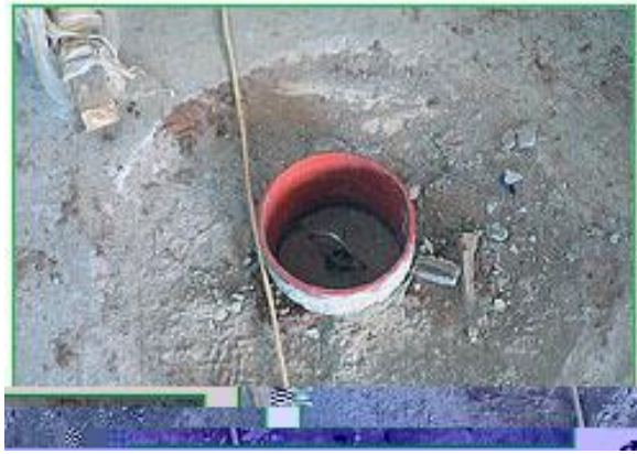
Рис. 1. Неправильний приямок.