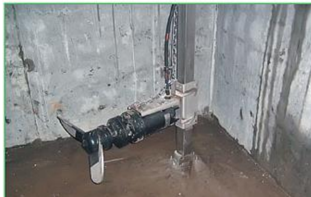
Рис. 5. Мішалка.

Найпоширенішою помилкою при будівництві приймального резервуару КНС або цеху розділення є неправильне його оснащення. Якщо діаметр приймального резервуару більше 2 м, то необхідно обладнати його стаціонарними мішалками (рис. 5), оскільки свинячий гній дуже швидко розшаровується: за 20 хвилин в осад випадає близько 80% твердих складових гною. Якщо гній не перемішувати, то резервуар швидко замулиться і буде потрібно додаткові витрати на його очищення.