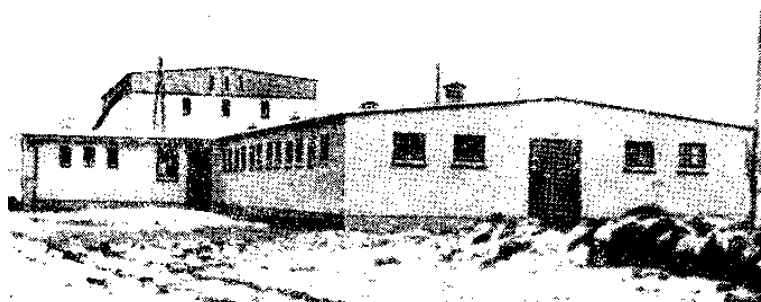
Рис. 2. Корівник для прив'язного утримання 90 корів з наземним кормосховищем і прибудованою молочною.