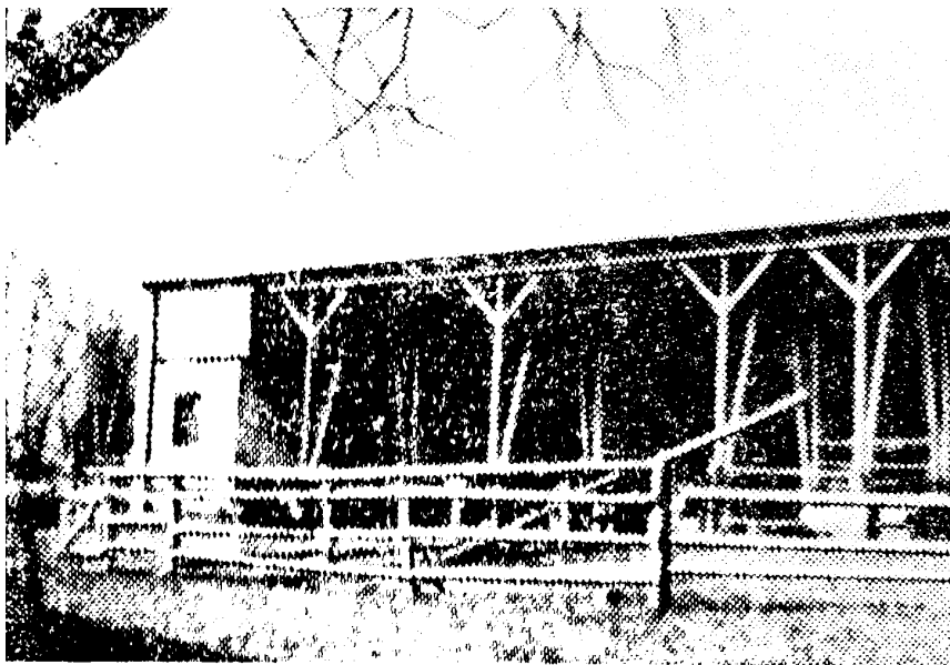
Рис. 3. Відкрите приміщення в Нейгаттерслебене.

Починаючи з 20-х років минулого століття в кліматично сприятливих середніх широтах США з'являються перші великі експериментальні приміщення з трьома стінками (південна сторона відкрита) і дахом для безприв'язного утримання тварин. Після 1945 р. вони знайшли широке застосування і в Європі. Таким чином було досягнуто сприятливі умови утримання ВРХ, зниження затрат на будівництво і збільшення продуктивності праці. В середині 50-х років минулого століття такі експериментальні приміщення почали поширюватись і на території Німеччини, зокрема, в Нейгаттерслебене (поблизу Магдебурга), в Науково-дослідницькому інституті тваринництва в Думмерсторфе і в Інституті селекції рослин в Гросс-Люзевице (рис. 3) [2]. На території України, Росії і Казахстану на початку 20-х років для тварин у дворі почали будували трьохстінних навіс (висота 2,2 м, довжина 52 м, ширина 4 м). Фасадна частина його була розміщена на північний схід, в сторону пануючих у зимовий час вітрів. Протилежну частину залишалась відкритою. Частину фасадної стіни (37 м) робили з дерев'яних щитів із щілинними проміжками між дошками від даху до основи (щілина 1–1,5 см). Іншу частину 15 м робили із суцільних, вітронепродуваємих щитів.