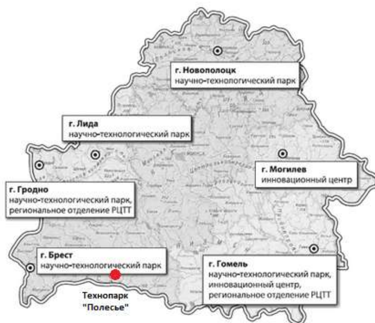
Рис. 3. Географическое расположение Технопарка

Однако, для заполнения данного Технопарка резидентами из числа действующих юридических лиц необходима их заинтересованность в комплексном сопровождении действующего бизнеса и/или возможности использования технологий, которые могут предоставить резиденты технопарка.