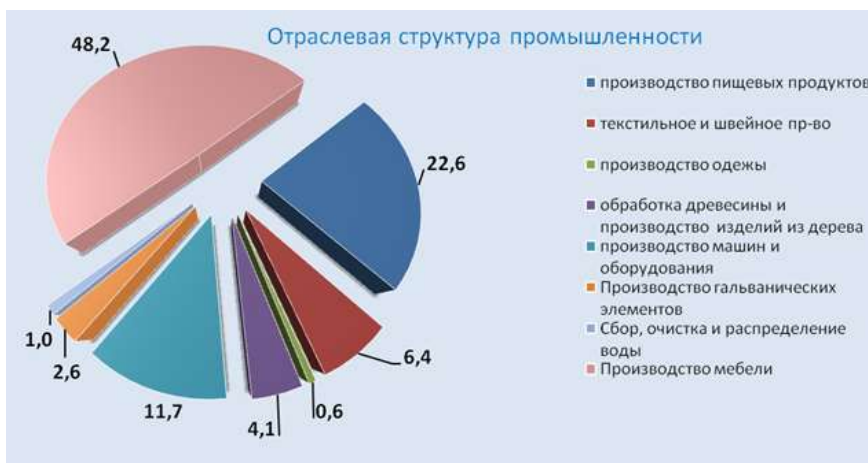
Рис. 1. Структура промышленности г. Пинск

В целом промышленный сектор экономики города объединяет трудоспособные коллективы, имеющие достаточный кадровый, производственный и экспортный потенциал.