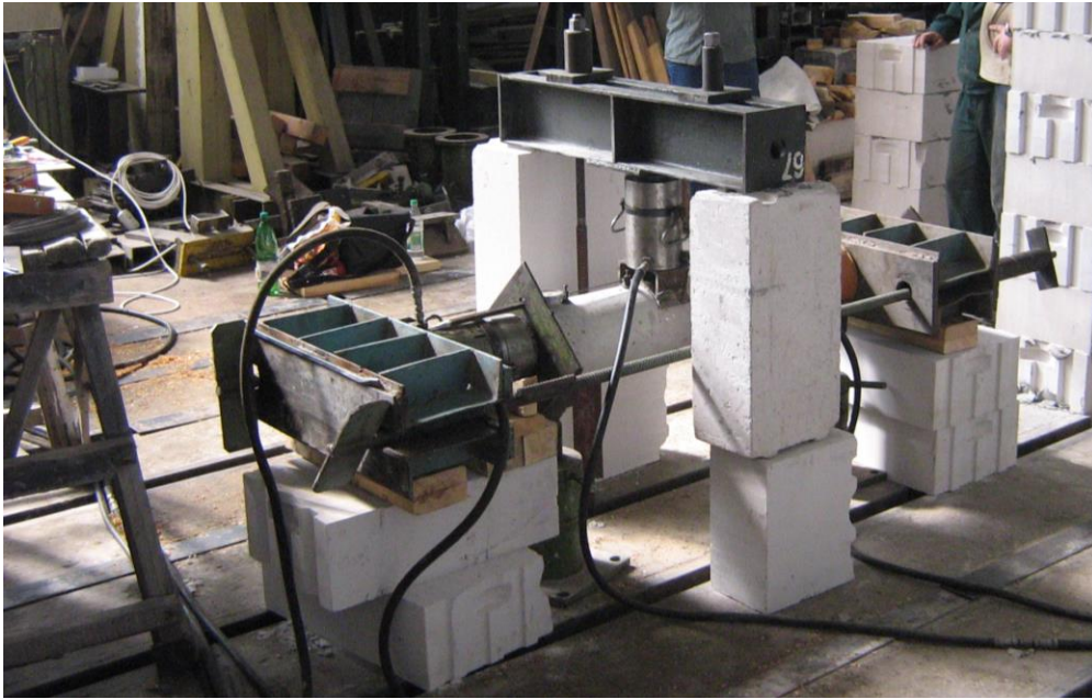
Рис. 1. Установка для проведення випробувань колон з попередніми обтисненням.

Результати випробувань показали, що при навантаженні від обтиску деформації не перевищували пружних значень. При подальшому, після попереднього обтиснення колони, поперечному вигині першими з'являлися нормальні тріщини в розтягнутій зоні в зоні прикладення зусилля при навантаженні, приблизно, 0,42 P_{\text{руйн}} , і деформації в стиснутій зоні \epsilon_b = 152 \times 10^{-5} , що, приблизно, в два рази перевищувало деформації в стиснутій зоні елементів без попереднього обтиснення у момент появи нормальних тріщин.