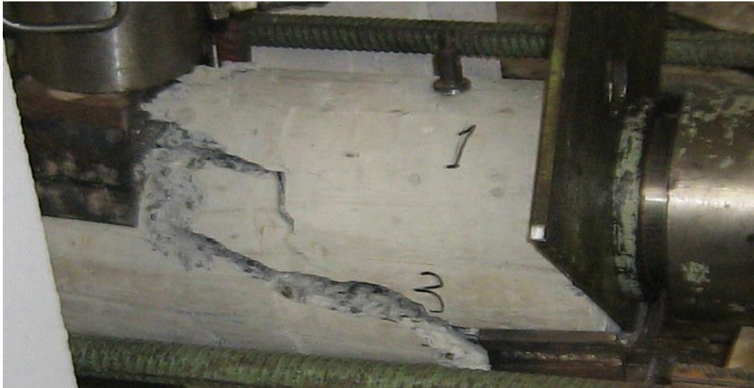
Рис. 2. Руйнування колони з попередніми обтисненням по похилому перерізу.

Зіставлення залежностей «момент-кривизна» для колон з поперечним обтисненням і без поперечного обтиснення, отриманих за результатами випробувань, наведено на рис. 3.