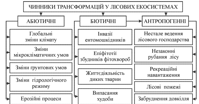
Рис. 1. Чинники трансформаційних процесів у лісових екосистемах

Основними абіотичними чинниками, що спричиняють трансформаційні процеси в лісових екосистемах насамперед є: зміни кліматичних (освітленість, температура, вологість, вітровий режим) і едафічних умов (родючість, структура та текстура, пористість, густина, водний та повітряний режими, хімічний склад) та гідрологічного режиму (підняття чи опускання рівня ґрунтових вод, наявність вологи в ґрунті) спричинених різноманітною антропогенною діяльністю чи дією несприятливих природних явищ та стихій (рис. 1).