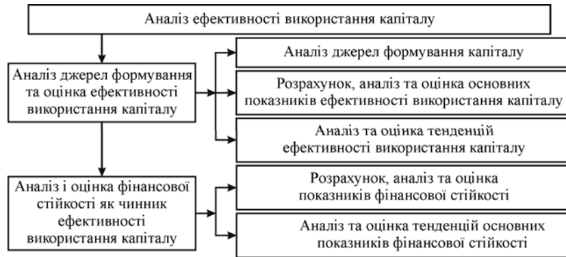
Рис. 2. Структурно-логічна схема аналізу формування та оцінки ефективності використання капіталу

На рис. 2 зображено структурно-логічну послідовність аналізу ефективності використання капіталу.