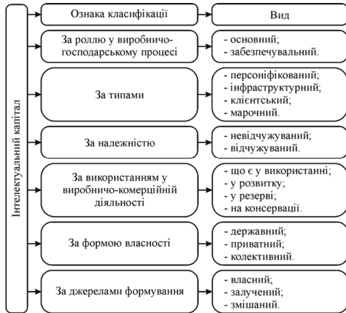
Рис. 2. Види інтелектуального капіталу

Ці класифікаційні ознаки не є вичерпними, їх можна доповнювати іншими ознаками, враховуючи завдання і цілі, які при цьому вирішуються.