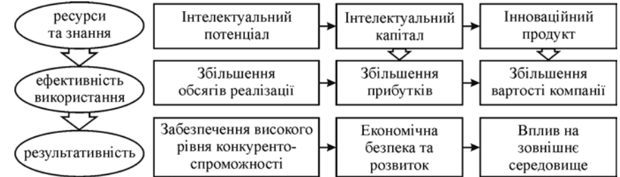
Рис. 3. Взаємозв'язок категорій інтелектуального капіталу, потенціалу та інновацій

Інтелектуальний потенціал пропонують розглядати як систему з властивими їй елементами, зв'язками і властивостями та системою забезпечення [18]. З теоретичного погляду, інтелектуальний потенціал означає можливість досягнення мети, а інтелектуальний капітал – засіб її досягнення [19], отже, інтелектуальний капітал – це ефективно використаний інтелектуальний потенціал. Місце інтелектуального капіталу у господарському процесі будь-якої організації можна показати за допомогою моделі (рис. 3). Інтелектуальний капітал у загальному випадку характеризує систему знань, умінь, документів та відносин, які можуть стати джерелом доходу для людини чи організації [12].