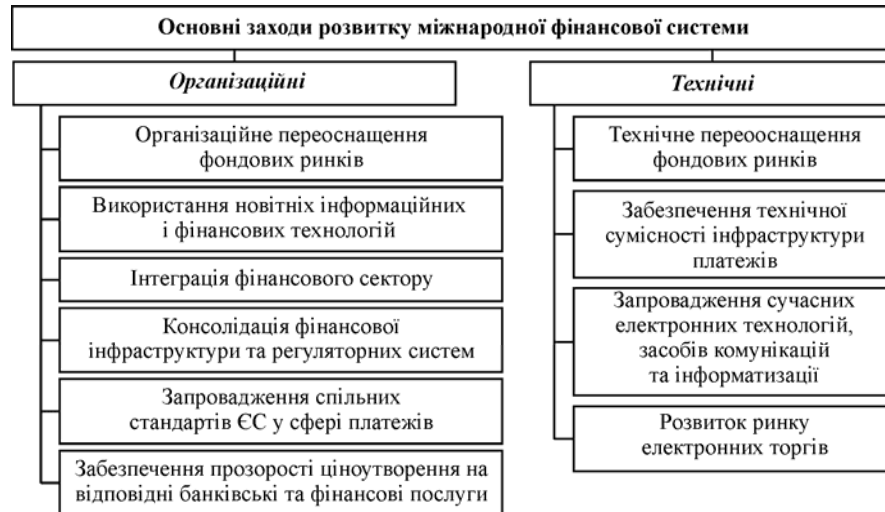
Рис. 1. Класифікація основних заходів розвитку міжнародної фінансової системи (Джерело. Складено автором на основі аналізу наукових публікацій [7, с. 12])

Міжнародна фінансова система формувалася досить давно. Проте "основні якісні зміни, що визначили розвиток світової фінансової системи" [1, с. 10], сталися в останні 30 років минулого століття. Розвиток і функціонування фінансової системи відбуваються у складних умовах, умовах посилення концентрації фінансово-промислового капіталу; інтернаціоналізації фінансових ринків; глобалізації фінансових потоків тощо [9, с. 13]. Подальшому розвитку міжнародної фінансової системи сприяли організаційні й технічні заходи (рис. 1).