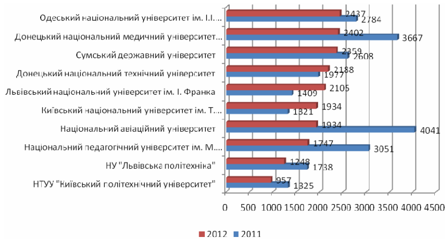
Рис. 2. Представленість українських університетів в рейтингу Webometrics у 2011-2012 рр.

їхню цитованість для кожного академічного домену (15 %). Рейтинг проводять за методикою, яка базується на Берлінських принципах визначення рейтингу вищих навчальних закладів, які розробило ЮНЕСКО [3]. У цьому рейтингу найвищу позицію з-поміж українських університетів зайняв у 2012 р. Національний технічний університет України "КПІ", який піднявся з 1325 на 957 місце у загальній таблиці університетів світу (рис. 2). Можна вести мову про зайняте гідне місце українських університетів в рейтингу за ступенем представленості їх сайтів в мережі Інтернет, якщо зважити, що останнє дослідження охоплювало 12000 вищих навчальних закладів світу. Водночас, українські університети не ввійшли навіть в першу тисячу в названому рейтингу, відтак – місце для самовдосконалення українських університетів є і в цьому напрямку.