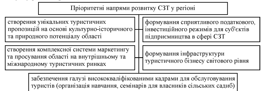
Рис. 2. Пріоритетні напрями розвитку СЗТ у регіоні

Мета розроблення цієї стратегії полягає у визначенні важливих цілей становлення СЗТ. Можна виділити п'ять пріоритетних напрямів розвитку цієї галузі у регіоні (рис. 2).