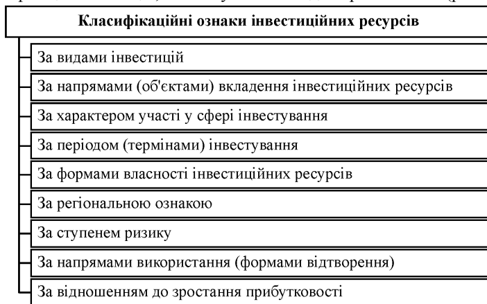
Рис. 3. Класифікаційні ознаки інвестицій

Отже, приріст капіталу за рахунок вкладення інвестицій можна цілком назвати процесом інвестування [5, с. 14]. Отже, економічну сутність інвестицій можна сформулювати таким чином: інвестиції – це вкладення капіталу, який вилучається із бюджету учасника інвестиційної діяльності в інновації, з метою отримання прибутку або досягнення відповідного економічного чи соціального ефекту. Аналізуючи публікації економістів і науковців, а також процеси, які відбувались у період попередніх та останньої фінансово-економічної кризи, можна стверджувати, що в інвестиційній діяльності як держави, так і інших суб'єктів інвестиційного процесу основу основ інвестиційного процесу становлять ресурси (інвестиційні кошти), а похідними є решта: розроблення інвестиційного проекту, його реалізація та отримання відповідного ефекту. Економічну сутність і природу інвестування вітчизняної економіки досить чітко визначає класифікація інвестицій, в основу якої закладено різні ознаки (рис. 3).