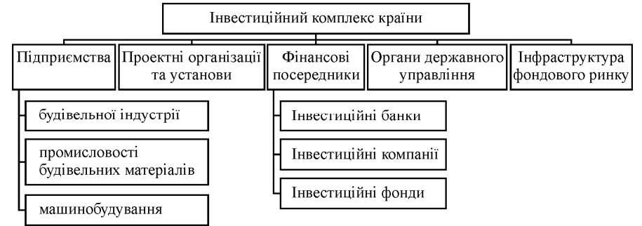
Рис. 1. Структура інвестиційного комплексу країни

безпосередньою умовою їхньої діяльності з одного боку, а з іншого – стабільність економічного зростання країни істотно залежить від рівня стійкості банківської системи та її ефективного функціонування [4, с. 122-125; 18, с. 12].