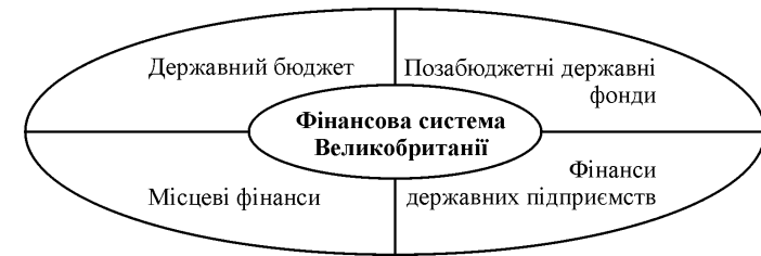
Рис. 1. Структура фінансової системи Великобританії (сформував автор)

Виклад основного матеріалу. Фінансова система будь-якої країни – це сукупність взаємопов'язаних і взаємодіючих часток, ланок і елементів, які безпосередньо беруть участь в ефективному її функціонуванні [3, с. 15], або як "сукупність урегульованих фінансово-правовими нормами окремих ланок фінансових відносин і фінансових установ, за допомогою яких держава формує, розподіляє і використовує централізовані та децентралізовані грошові фонди" [10, с. 420]. Фінансова система складається з фінансових інститутів, що здійснюють і регулюють фінансову діяльність, та фінансових інструментів, які створюють відповідні умови для реалізації фінансових процесів [3, с. 15]. Фінансові системи різних країн формувались і розвивались по-різному, і, звичайно, у кожній країні є свої, відмінні від інших країн, особливості побудови фінансової системи, а тому дослідження розбудови фінансової системи у Великобританії є досить важливим. Фінансова система цієї країни включає до свого складу державний бюджет, відповідні фонди та фінанси місцевих громад і фінанси державних підприємств (рис. 1).