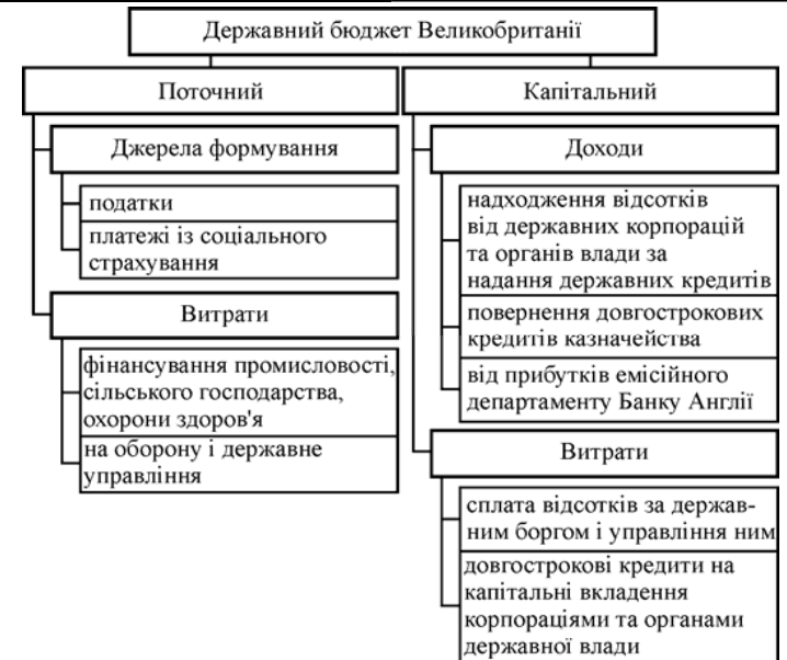
Рис. 2. Структура Державного бюджету Великобританії (сформував автор)