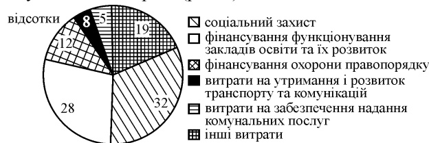
Рис. 3. Структура витрат місцевих органів влади (сформував автор)

На сьогодні з місцевих бюджетів фінансується близько 36 % усіх державних витрат, які направляються на соціальний захист, розвиток освіти, комунальні послуги та інші витрати (рис. 3).