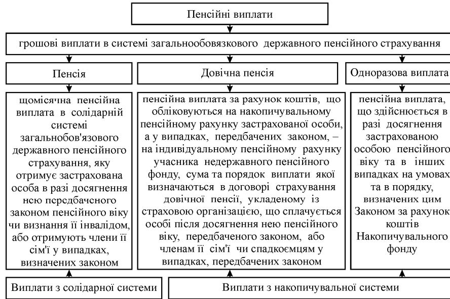
Рис. 2. Структура пенсійних виплат в українському законодавстві

приклад Росії і Казахстану, пенсія стосується також і виплат з накопичувальної системи (рис. 3).