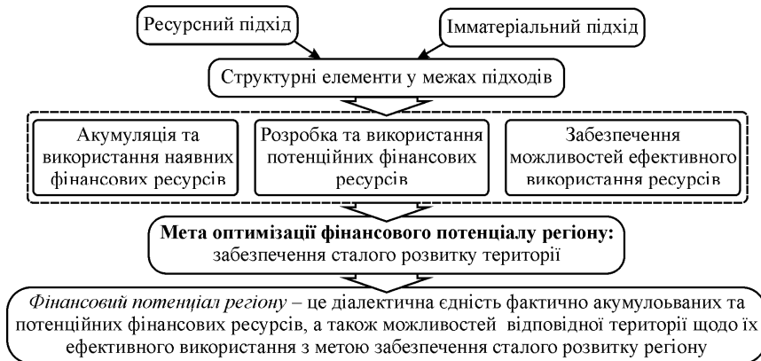
Рис. 2. Структурно-логічна схема авторського науково-методичного підходу до розуміння сутності категорії "фінансовий потенціал регіону"

Після з'ясування ключових складових фінансового потенціалу регіону та цілей його оптимізації доцільно узагальнити та систематизувати отримані результати у авторському баченні сутності цього поняття (рис. 2).