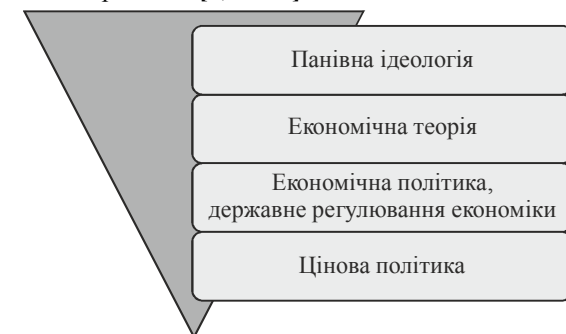
Рис. 3. Теоретико-ідеологічні детермінанти цінової політики держави

Економічна теорія і політика тісно пов'язані з конкретними ідеологіями і по суті виражають їхні економічні рекомендації (рис. 3, 4). Провідними ідеологіями сьогодні вважаються лібералізм (класичний і сучасний), соціал-демократизм та консерватизм [4, с.114].