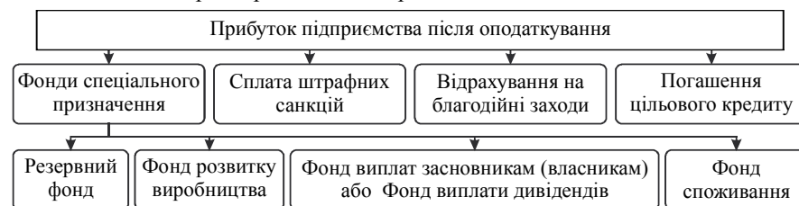
Рис. 1. Напрями розподілу чистого прибутку підприємства [2, с. 63]

На рис. 1 подано схему напрямів можливого використання прибутку, що залишається в розпорядженні підприємства після сплати податків.