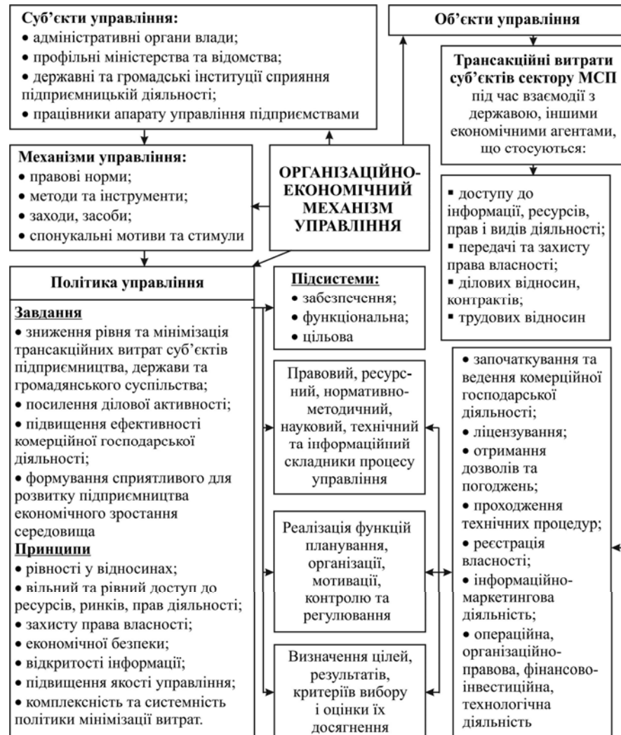
Рис. Конфігурація організаційно-економічного механізму управління транзакційними витратами малого і середнього підприємництва в Україні

сакційними витратами підприємств малого і середнього підприємництва, об'єктів, політику управління з її необхідними підсистемами. Важливо зазначити, що в поданому вигляді конфігурація організаційно-економічного механізму відповідає таким вимогам, як: комплексність, безперервність, законність, плановість, економічність, взаємодія та компетентність.