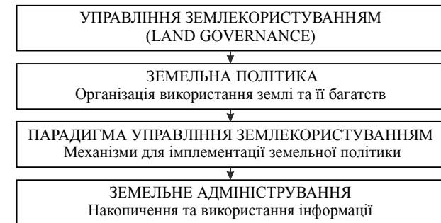
Рис. 2. Ієрархічна схема управління землекористуванням

Однак, враховуючи, що земельна адміністративна система здатна надавати детальну інформацію, адже вона побудована на основі земельно-кадастрово-реєстраційної системи, і спроможна, відповідно до Басортської декларації, забезпечувати "сталий розвиток", її потрібно розглядати як основу для ефективного управління (good governance). Коротко проаналізувавши основні дефініції "управління землекористуванням", ми зобразили ієрархічну схему управління землекористуванням (рис. 2).