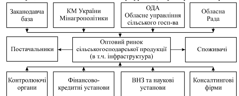
Рис. 2. Організаційно-економічний механізм регіонального оптового ринку сільськогосподарської продукції

Сільгоспвиробники зацікавлені в територіальній локалізації подібних об'єктів поблизу місць виробництва сільськогосподарської продукції, щоб оперативніше здійснювати її транспортування до місць масового вжитку. Водночас, заготівельні організації надають перевагу розміщенню подібних об'єктів на території з високим рівнем розвитку транспортної інфраструктури, а переробні підприємства – розміщенню інфраструктурних об'єктів, якомога ближче до них. Вважаємо, що схема розміщення таких об'єктів повинна розроблятися не на основі відомчих інтересів, а виходячи з цілей розвитку агропродовольчого ринку всього регіону. Організаційно-економічний механізм оптового ринку сільгосппродукції повинен охоплювати систему державних, ринкових і суспільних інститутів, що реалізують набір функцій із стимулювання виробництва, зберігання, перероблення, раціонального транспортування та імпорту, а також реалізації у роздрібній торговельній мережі з врахуванням фізіологічних потреб населення, а також існуючої нормативно-правової бази. Тому цей механізм може мати конфігурацію, яку зображено на рис. 2.