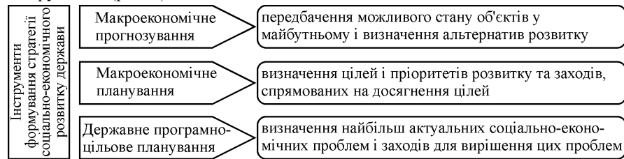
Рис. 2. Характеристика інструментів формування стратегії соціально-економічного розвитку держави

ально-економічного розвитку держави здійснюється на основі відповідних інструментів (рис. 2).