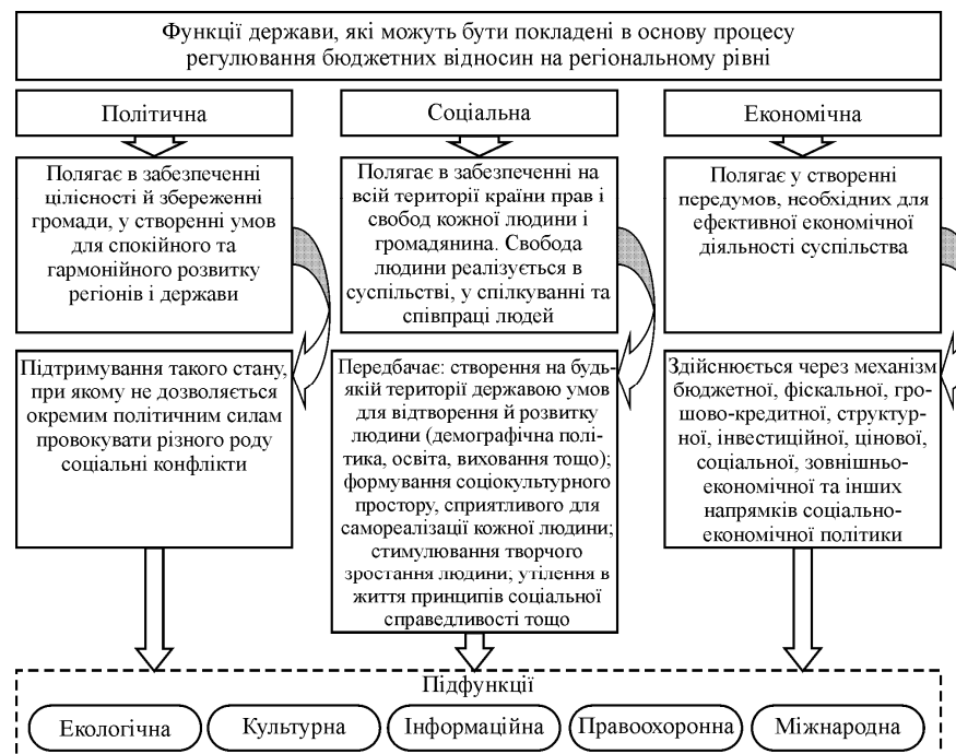
Рис. 1. Характеристика функцій держави, які можуть бути покладені в основу процесу регулювання бюджетних відносин на регіональному рівні

Сучасна держава виконує велику кількість функцій, які умовно можна поділити за різними ознаками. Вивчаючи погляди дослідників [2, с. 8-9; 5] на виконання функцій держави, які можуть бути покладені в основу процесу регулювання фінансово-бюджетних відносин органами місцевого самоврядування в регіоні, автор пропонує функції, наведені на рис. 1.