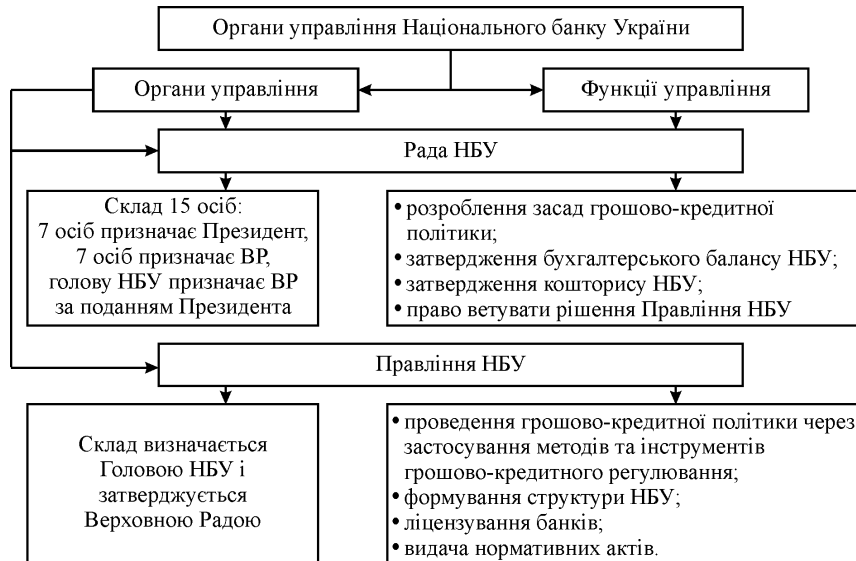
Рис. 2. Структура органів управління НБУ та їх функції

Згідно із законодавчо-нормативними актами, було сформовано систему управління НБУ та його функції, яка могла б збалансувати інтереси всіх учасників процесу управління. На рис. 2 подано структуру органів управління НБУ та їх функції.