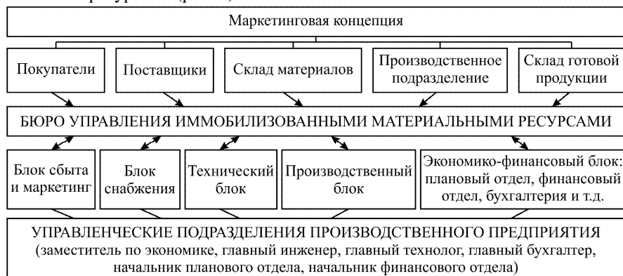
Рис. 2. Схема управления иммобилизацией материальных ресурсов промышленного предприятия

тивные показатели должны интегрироваться по своевременному контролю и анализу их изменения. Для этого рекомендуется в составе управленческого персонала предприятия организовать Бюро по контролю и управлению иммобилизованными ресурсами (рис. 2).