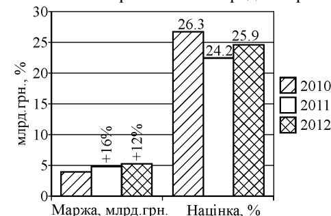
Рис. 2. Динаміка аптечної маржі від реалізації фармацевтичної продукції і середньозважені націнки за 2010-2012 рр., %

Варто зауважити, що і географічний розподіл роздрібної реалізації фармацевтичної продукції в розрізі регіонів є досить неоднорідним. Так, 6 із 26 регіонів України акумулюють близько 50 % аптечного виторгу в країні. Лідерами роздрібних продажів стали Київ, Донецька, Дніпропетровська, Харківська, Одеська області та АР Крим.