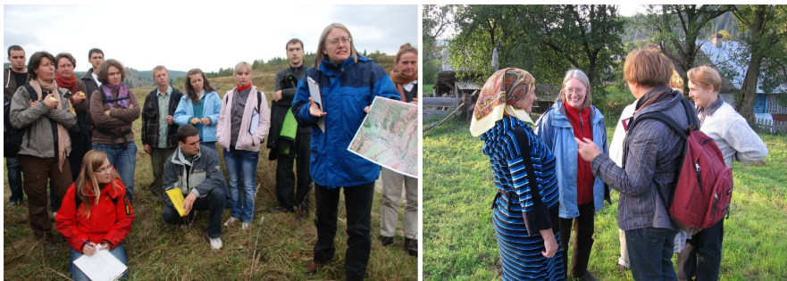
Рис. 1. Українсько-австрійські експедиції в Карпатах 2009 та 2012 рр.

Досвід ландшафтного планування набули під час спільних українсько-австрійських експедицій 2009 та 2012 рр., які проводили у сільських ландшафтах Сколівщини, Турківщини та Старосамбірщини (рис. 1), а також аналогічних експедицій 2009 та 2011 рр. у ландшафтах Верхньої та Нижньої Австрії і Бургенляндії (Австрія).