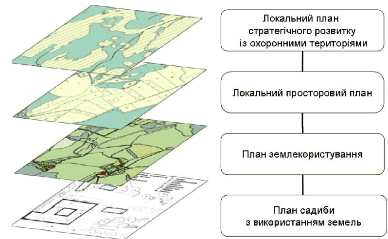
Рис. 3. Ієрархія просторового планування (Австрія)

Вплив урбанізаційних процесів на сільські ландшафти відбувається на різних ієрархічних рівнях системи розселення і їхні прояви можна відстежувати на мікро-, мезо-, та макрорівнях, починаючи від елементарної "клітини" – садиби, закінчуючи локальною системою розселення, включно до районного центру або планувального району, який може об'єднувати різні адміністративно-територіальні одиниці або їх частини. Австрійські колеги з Віденського аграрного університету використовують чотири 1 ієрархічні рівні, на яких розглядають об'єкти досліджень (рис. 3).