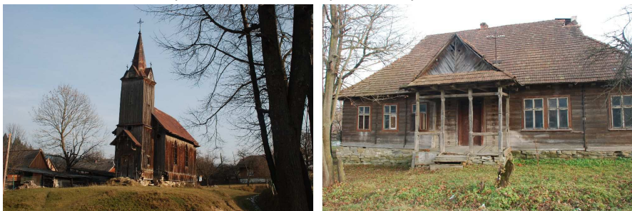
Рис. 6. Цінна дерев'яна забудова с. Розлуч Турківського району