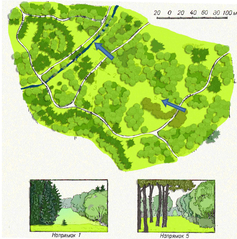
Рис. 2. Тростянецький парк. Приклад організації відкритого простору. Горіхова галявина [2]

нантами паркового простору. Вони мають велику кількість світлотіньових співвідношень та створюють багато чисельні мальовничі перспективи, різноманітні за глибиною сприйняття пейзажів. Вони залежать від розмірів і форми ділянки в плані, рельєфних особливостей, кольорової гами насаджень, характеру освітлення (експозиції), віку і характеру розміщення насаджень та їх типу [1]. Розмір відкритої ділянки та висота дерев у масиві сприяють формуванню виразності силуету пейзажу. У Тростянецькому парку масштабним є співвідношення між висотою дерев у узліссі, поодинокими деревами і розмірами відкритого простору галявини. Так, цікавим прикладом організації невеликого простору парку є галявина з розташованими на ній окремими екземплярами старих горіхів, яка займає всього 0,4 га. Вона компактна за формою і орієнтована з півдня на північ. Її пересікає прогулянковий доріжка завширшки 3 м, яка прокладена вздовж східної сторони простору галявини. Узлісся галявини складається з ялини звичайної висотою 18 м, липи дрібнолистої і клена гостролистого приблизно такої ж висоти. Фоном для узлісся слугують сосни. Вони значно вищі, ніж узлісся. Безпосередньо до галявини примикає тільки декілька з них. Солітерами, які оформлюють галявину, є потужні екземпляри горіха сірого з великою розкидистою кроною. До структури насаджень галявини також входять ще дві сосни Веймутова і група з туї західної (рис. 2).