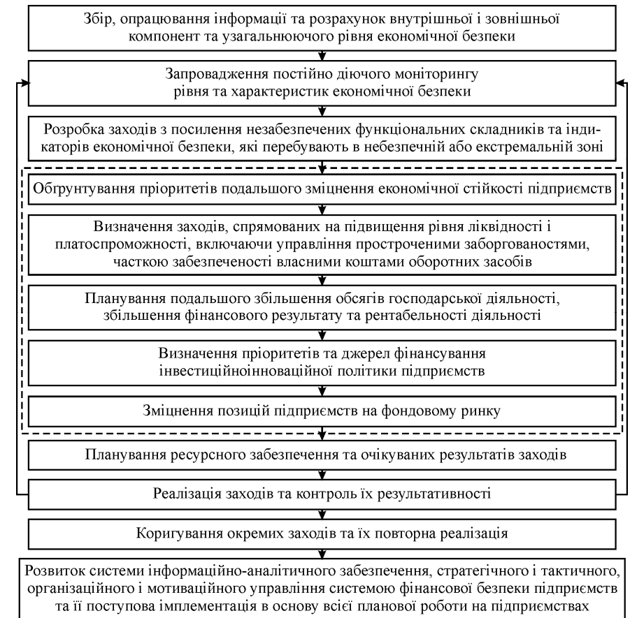
Рис. Послідовність заходів розвитку системи економічної безпеки малого підприємства

Політика зі зміцнення економічної безпеки малих підприємств може передбачати також такі дії, як аналіз можливих негативних фінансових наслідків розвитку виробничої, маркетингової, комерційної підсистем підприємства щодо стану і змін, її платоспроможності, рентабельності та прибутковості; вивчення ринку цінних паперів щодо стану привабливості на ньому цінних паперів підприємства, залучення фінансових засобів та інвестицій для розвитку, а також стосовно захисту акцій від неправомірного захоплення та встановлення контролю над майном суб'єкта господарювання; оцінка інвестиційних проектів стосовно аналогічних параметрів; вивчення комерційних та ділових пропозицій тощо.