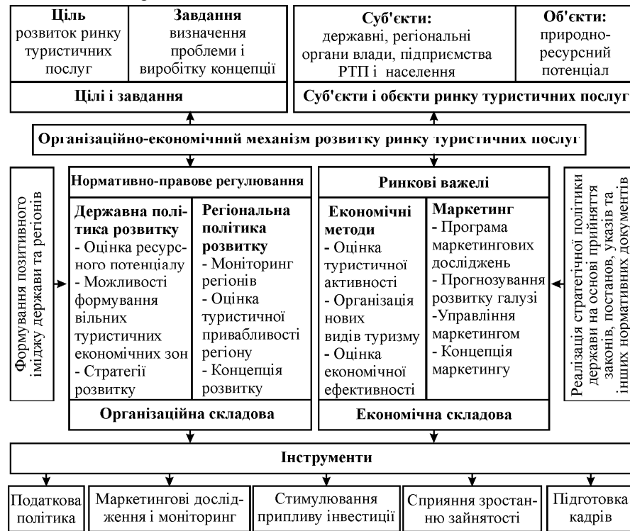
Рис. Організаційно-економічний механізм розвитку ринку туристичних послуг

лення, так і в ході життєдіяльності. Треба зазначити, що організаційний механізм неможливо розглядати без економічної складової.