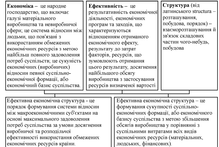
Рис. 2. Схема узгодження понять, внаслідок аналізу і синтезу яких було виведено поняття "ефективної економічної структури"

Під час трактування змісту терміна "ефективність" досить часто його визначають як "...здатність приносити ефект, спричиняти дію" [9]. Що може визначатися як ефект від формування ефективної економіки країни?