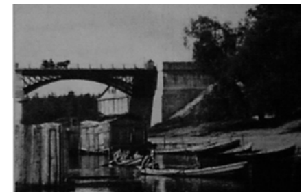
Рис. 3. Купальні на р. Тетерів поблизу парку (фото 1785 р.)