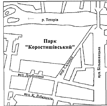
Рис. 1. План-схема розташування території парку-пам'ятки "Коростишівський" Житомирської області

Історичний аналіз розвитку території дав змогу виділити основні етапи формування парку-пам'ятки садово-паркового мистецтва XVIII-XIX ст. "Коростишівський". Коростишівський парк було закладено у 1820 р. у романтичному стилі й є результатом спільної праці Г.П. Олізара (1798-1865 рр.) – відомого політичного й державного діяча XIX ст., і видатного садівника Європи першої половини XIX ст. Діонісія Міклера (1762-1853 рр.) [7].