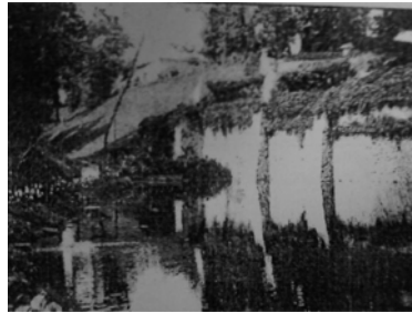
Рис. 4. Став поблизу фортечної середньовічної стіни (фото 1918 р.)

"Гра" з каменем у композиціях парку викликала загальне захоплення всіх його відвідувачів. У парку було кілька озер (рис. 2). Посередині одного було штучно створено острів із бесідкою. Поряд із новим будинком Олізар зводить у стилі швейцарських шале, зовсім не типових для Полісся, кілька службових приміщень.