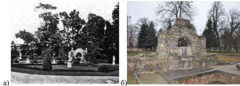
Рис. 5. Партер на верхній терасі: а) фото початку ХХ ст.; б) сучасний стан

Там, де р. Тетерів розділялися на декілька рукавів, утворюючи острови, з'явилась "Країна Амазонія". На верхній терасі, де раніше стояв замок, височів партер (рис. 5), у центрі якого були декоративний басейн та гранітна арка із зображенням масонських символів. Партер був оточений галереєю якісних копій з античних скульптур, а біля будинку стояли майстерно зроблені фігури сфінксів [4].