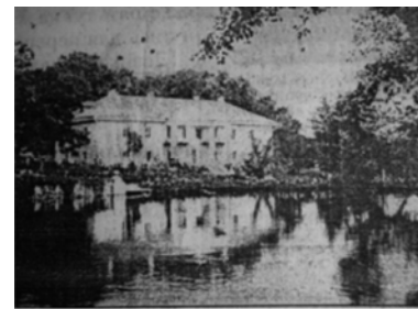
Рис. 2. Озеро в нижній частині парку (фото 1914 р.)

Досить вдало в парку було вирішено питання щодо водної системи. Незважаючи на близькість річки, водоймища, своєрідні озера були утворені й на верхній, середній та нижній терасах (рис 2, 3, 4). Каскади квітів обплітали сходи і спускались до води. Гранітні виступи скель були увінчані рідкісними, характерними для кам'янистих ландшафтів, рослинами та килимами лікарських трав [3, 4]. Діонісію Міклеру як художнику властиве романтичне бачення природи. Використовуючи існуючий ландшафт, художник продуманими акцентами надавав йому запрограмованого змісту. У системі планування яскраво виділяються окремі елементи й композиційні прийоми, що формують неповторність і самобутність композиції цього парку.