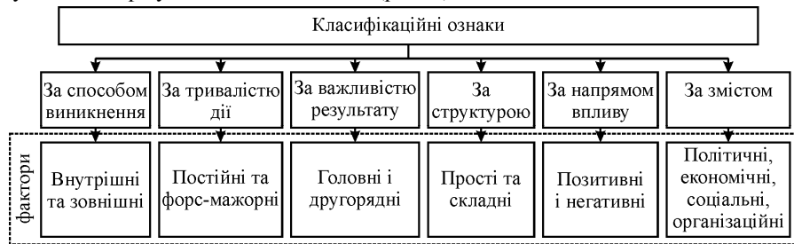
Рис. 1. Класифікація факторів, які впливають на стійке функціонування комерційних банків

Зазвичай, коли йдеться про чинники стійкості комерційного банку, то в більшості випадків апелюють до зовнішніх і внутрішніх факторів. Ми пропонуємо класифікувати їх таким чином (рис. 1).