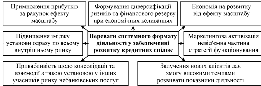
Рис. 1. Основні переваги системної діяльності кредитних спілок

Роль системної діяльності у процесі розвитку кредитних спілок в Україні потрібно розглядати в контексті внутрішніх та інтеграційних покращень, підвищення ефективності функціонування та розширення мережі продаж. Основні переваги системної діяльності для кредитних спілок зобразимо на рис. 1.