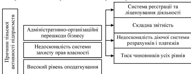
Рис. Причини тіньової активності підприємств

Причини тіньової активності легально функціонуючого підприємства представлено на рис. 1. Глобалізація, створення спільних підприємств, виникнення та розквіт транснаціональних корпорацій поставили перед наукою про фінансовий контроль та практикою нові проблеми. Теорія та практика контролю, його вплив на процес відтворення в кожній з країн тривалий час орієнтувались на національні сторони організації контролю, тому в розвитку науки і практики здійснення контролю виявились складності, пов'язані з не розробленістю теоретичних основ фінансового контролю в умовах глобалізації.