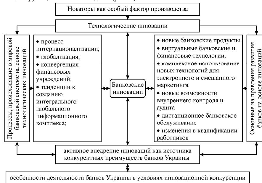
Рис. 3. Функциональная модель развития инновационной конкуренции в банках Украины

Анализ литературы и собственное исследование позволили выявить, что банки Украины осуществляют свою деятельность под влиянием ряда факторов, которые способствуют развитию инновационной конкуренции в этой сфере, побуждают банки к поиску новых, инновационных, источников конкурентных преимуществ, резервов конкурентоспособности. По нашему мнению, процесс развития инновационной конкуренции в банках Украины можно описать с помощью функциональной модели (рис. 3)