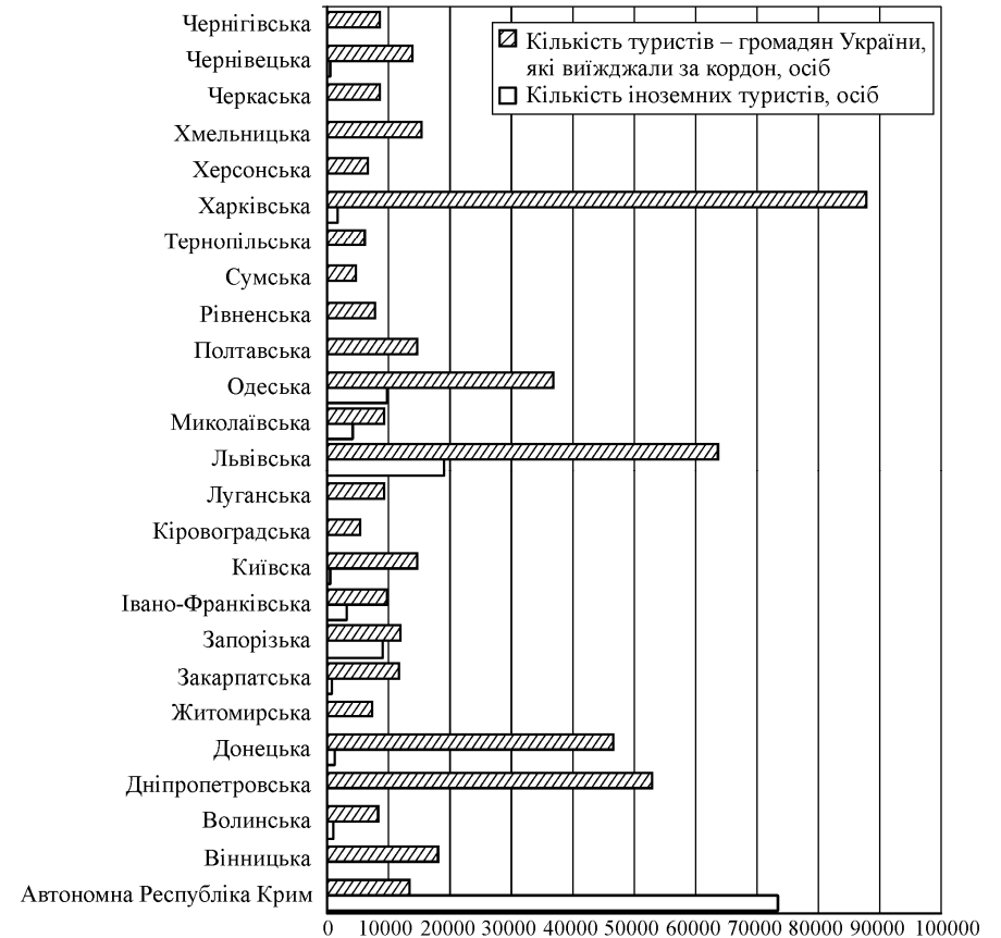
Рис. 1. Кількість туристів, обслуговуваних суб'єктами туристичної діяльності в розрізі регіонів України за 2012 рр.

За даними органів державної статистики України [2], за 2012 р. найбільше іноземні туристи відвідували міста Київ (44,4 %) та Севастополь (10,5 %), Автономну республіку Крим (26,4 %), Львівську (6,8 %), Одеську (3,5 %), Запорізьку (3,3 %) області; частка іноземних туристів, які відвідали інші області становить 5,1 %. Найменш відвідувані області іноземними туристами – Рівненська, Тернопільська та Хмельницька (рис. 1).