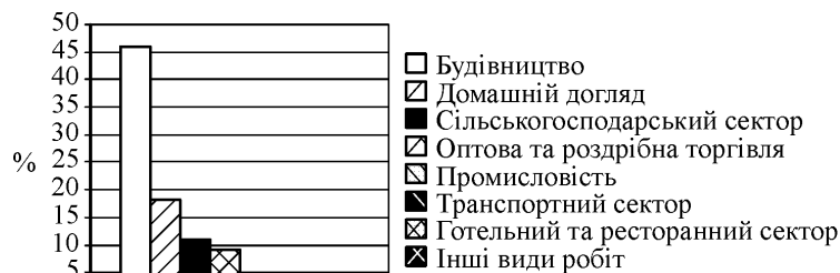
Рис. 1. Основні сфери працевлаштування українських трудових мігрантів у 2010-2012 рр. (складено та розраховано за даними [4])

Майже дві третини усіх мігрантів обрали місцем призначення країни Європи (72 млн) та Азії (72 млн). Найпопулярнішою серед країн, що прийняли мігрантів, залишаються Сполучені Штати. Загалом тут проживає майже 46 мільйонів осіб, народжених за межами країни. У період між 1990 та 2013 рр. США прийняли 23 млн осіб – це майже мільйон на рік. Росія у цьому списку посіла друге місце, повідомляє інформагенція dra. На її просторах оселилося 11 млн мігрантів. Німеччина стала новою батьківщиною для майже 10 млн мігрантів. Активно приймали мігрантів і Саудівська Аравія (9,1 млн), ОАЕ та Великобританія (по 7,8 млн). Далі у списку ідуть Франція (7,4 млн), Канада (7,3 млн), Австралія та Іспанія (обидві прийняли 6,5 млн осіб).