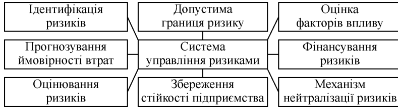
Рис. 2. Система управління ризиками підприємства

На рис. 2 представлено систему заходів, за якою можна здійснювати процес управління ризиками на суб'єкті господарювання.