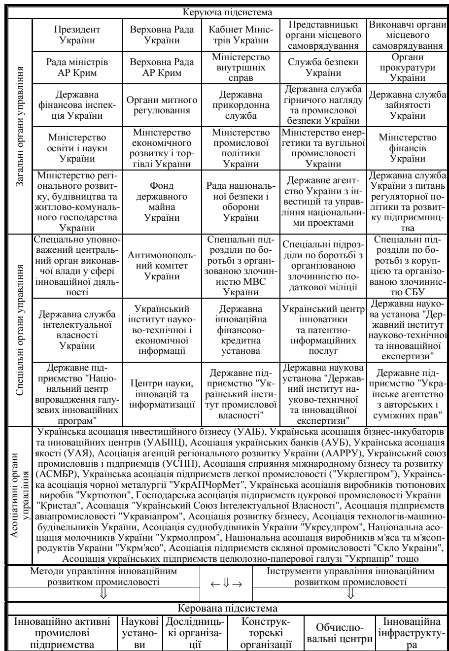
Рис. 2. Механізм активізації та забезпечення інноваційного розвитку промисловості, спрямованого на подолання недосконалої конкуренції (Складено автором)

О. Кузьмін та О. Мельник визначають методи як способи і прийоми цілеспрямованого впливу суб'єкта на керований об'єкт для досягнення установлених цілей [1, с. 125]. Під методами управління інноваційним розвитком промисловості в умовах недосконалої конкуренції варто розуміти способи та прийоми організування та регулювання інноваційних процесів у сфері промисловості на макрорівні з метою досягнення цілей інноваційного розвитку та подолання негативного впливу на цей процес умов недосконалої конкуренції. Методи впливу керуючої підсистеми на керовану за спрямуванням регулятивно-стимулювального впливу можна виділити такі: загальні методи – примус (кримінальна відповідальність за здійснення неправомірних корупційних дій) та переконання (демонстрація позитивного зарубіжного досвіду побудови інноваційних макроекономічних моделей); економічні або методи матеріального впливу (рівень заробітної плати науковців у бюджетних наукових установах, створення вільних економічних зон із пільговими умовами для новаторів); методи адміністративного впливу (законодавство у сфері інноваційної діяльності й боротьби з корупцією та організованою економічною злочинністю); психологічні або методи морального впливу (вручення відзнак, нагород, присвоєння звань науковцям, працівникам інноваційно активних промислових підприємств).