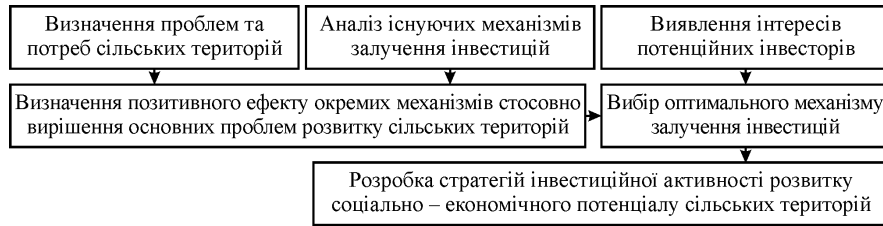
Рис. 2. Стратегія інвестиційної активності розвитку соціально-економічного потенціалу сільських територій України

З метою підвищення ефективності управління процесами інвестування розвитку соціально-економічного потенціалу сільських територій та взаємодії органів місцевої виконавчої влади і місцевого самоврядування необхідно надати повноваження з координації спільних дій управлінню економіки адміністрацій відповідних рівнів, яке узгоджує свої дії з постійною комісією з питань підприємництва, промисловості, інвестицій та зовнішньоекономічних зв'язків.