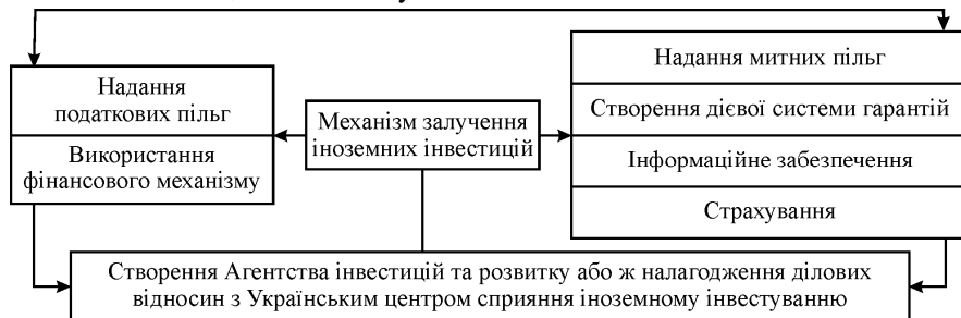
Рис. 3. Механізм залучення іноземних інвестицій у розвиток соціально-економічного потенціалу сільських територій

На міжнародному ринку інвестиційних капіталів одним із найефективніших засобів конкурентної боротьби за інвестиції є надання інфраструктурних послуг, що забезпечують інвесторам зниження витрат та реалізацію конкретних інвестиційних проектів. Щоб залучити іноземних інвесторів у розвиток соціально-економічного потенціалу сільських територій, доцільно створити дієвий механізм залучення іноземного капіталу (рис. 3), який забезпечить створення привабливого інвестиційного клімату.