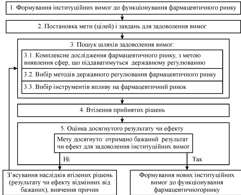
Рис. Схема механізму державного регулювання фармацевтичного ринку

Державне регулювання має свої функції, інструменти (методи) та відповідні органи. Зокрема, головні функції державного регулювання фармацевтичного ринку такі: 1) підтримка пропорційності виробництва та споживання, антициклічне регулювання; 2) підтримка та розвиток конкуренції, антимонопольні заходи; 3) перерозподіл доходів та соціальний захист підприємців і споживачів фармацевтичних товарів. До інструментів, або методів державного регулювання підприємництва, належать: податково-бюджетна система (фіскальна); цінове регулювання; кредитно-грошове регулювання; зовнішньоекономічне регулювання (митні збори, ліцензії, квоти).