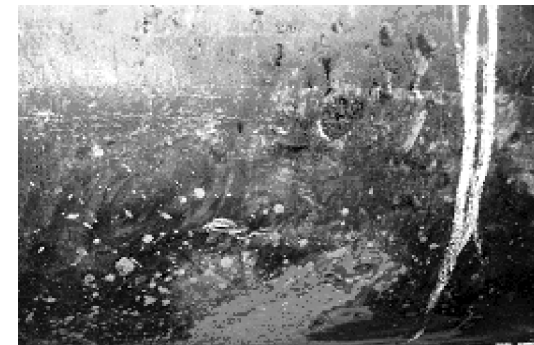
Рис. Система корозійних каверн на трубі діаметром 1420 мм магістрального газопроводу "Союз"

Крім руйнувань газопровідних труб, внаслідок стрес-корозійного розтріскування, були руйнування, зумовлені істотним впливом добових коливань робочого тиску в газопроводах, що у поєднанні з дією експлуатаційного середовища спричинило появу та розвиток тріщиноподібних дефектів у стінках труб за механізмом корозійної втоми. Також варто зауважити, що низьколеговані сталі, що використовуються для будівництва газопроводів, уразливі до корозії. Аналіз розподілу відмов з причин виникнення засвідчує, що 35-40 % руйнувань магістральних газопроводів – за даними українських та російських дослідників – зумовлені зовнішньою (рис. ) та внутрішньою корозією.