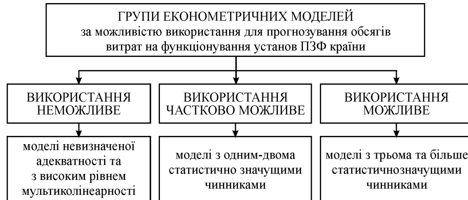
Рис. 3. Класифікація моделей за можливістю їх використання для прогнозування обсягів витрат на функціонування установ ПЗФ країни

Для збільшення числа адекватних моделей, які з достатньо високим рівнем довірчої ймовірності можна використовувати для прогнозування витрат на функціонування установ ПЗФ країни, пропонуємо їх удосконалення, що передбачає покрокове вилучення найменш значущих чинників, які впливають на обсяги фінансування діяльності установ ПЗФ країни.